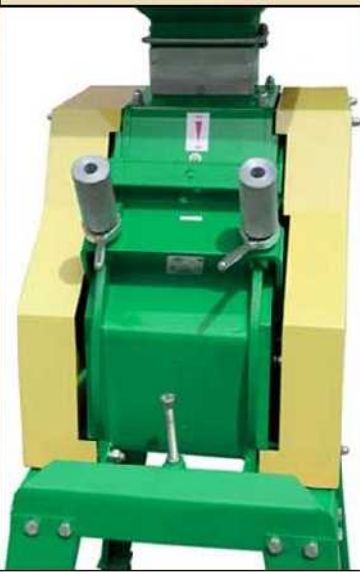
Réglage de l'aplatissage ↓

Le réglage du degré d'aplatissage s'effectue en agissant sur le levier à double molettes monté sur excentrique permettant un écartement des rouleaux facile et rapide à mettre en œuvre. Quant au débit, la trappe d'entrée règle le flux en fonction de la charge du moteur et du serrage des rouleaux.