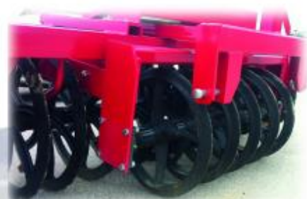
Réglage 3 positions de la rangée AR